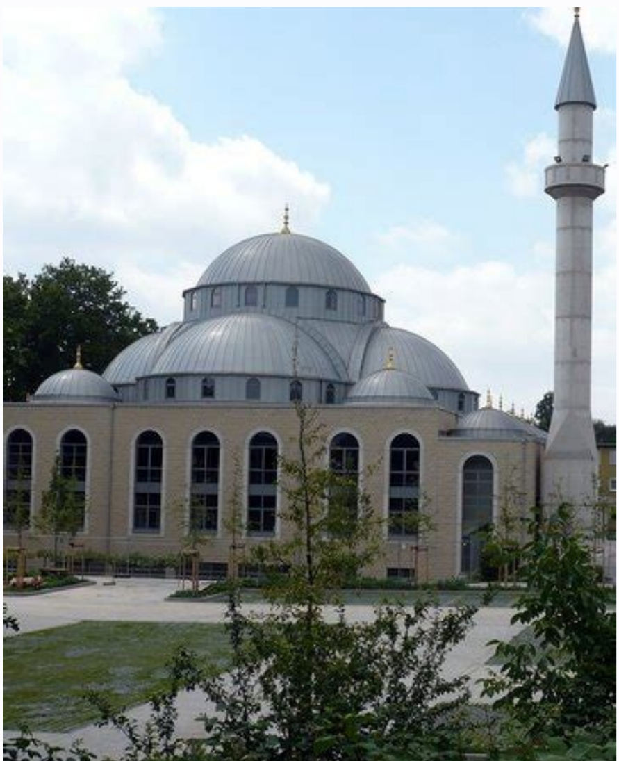
Lulu jubail timing during ramadan.